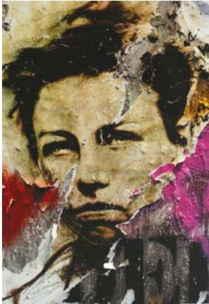
Arthur Rimbaud Ernest Pignon-Ernest

Cette exposition retrace le compagnonnage poétique de ces deux artistes à travers la présentation inédite de leurs dix-huit ouvrages, photographies, lithographies et dessins ainsi qu'un court-métrage. Le visiteur pourra ainsi prendre le temps de feuilleter leurs ouvrages, s'immerger dans la bibliothèque d'André Velter et même, s'il le souhaite, dessiner, écrire ou échanger un poème.